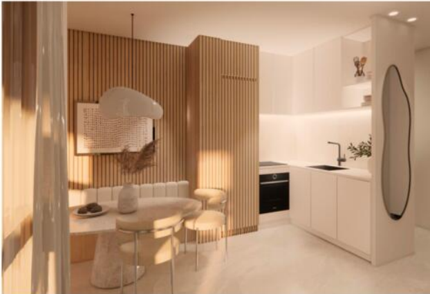
CUISINE + S MANGER