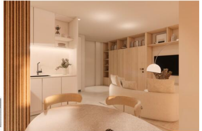
CUISINE + SA MANGER