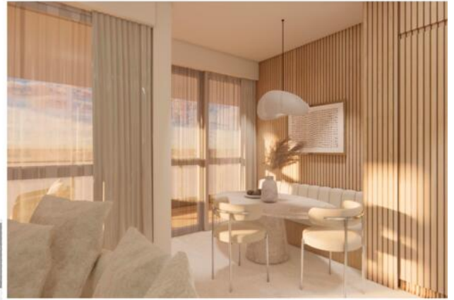
CUISINE + SA MANGER